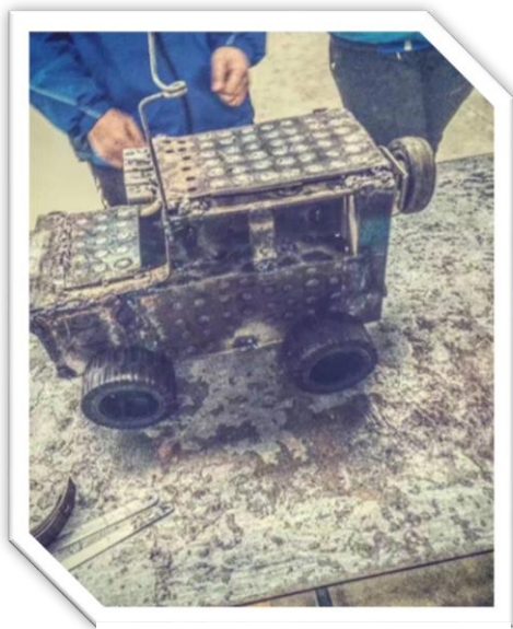
我的第一份实训作品